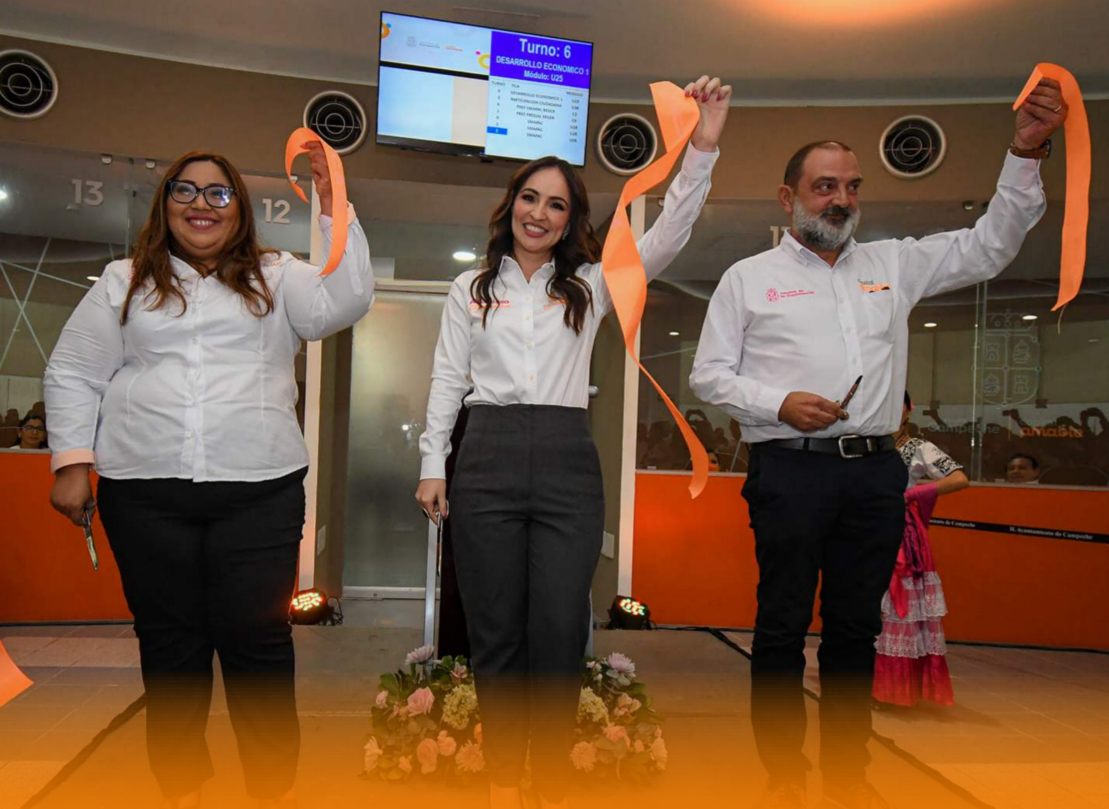
CENTRO DE ATENCIÓN MÚLTIPLE (CAM)

Representa a un gobierno que piensa en las y los ciudadanos.