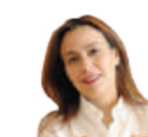
PILAR LOZANO MACDONALD DIPUTADA CIUDADANA PRESIDENTA DE LA COMISIÓN DEL MEXICANO MIGRANTE

El 14 de mayo la cadena de Televisión estadounidense CNN publicó algunas fotos de migrantes indocumentados detenidos por la patrulla fronteriza de McAllen, Texas, que muestran las condiciones paupérrimas en que se encuentran concentrados: en instalaciones saturadas, bajo tiendas de campaña, con evidentes carencias y durmiendo en el suelo con cobijas de papel reflejante.