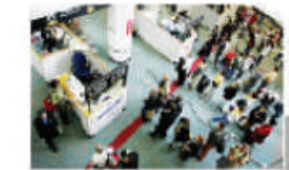
Migración documentada a EEUU

• En 2018, 71% de las personas que emigran a EEUU lo hace de manera legal. Esto es un 15% más que en 2014.