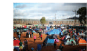
Devolución de migrantes a México (ene-may 2019)

• 4,217 centroamericanos fueron devueltos a México esperar su respuesta de solicitud de asilo a EEUU.